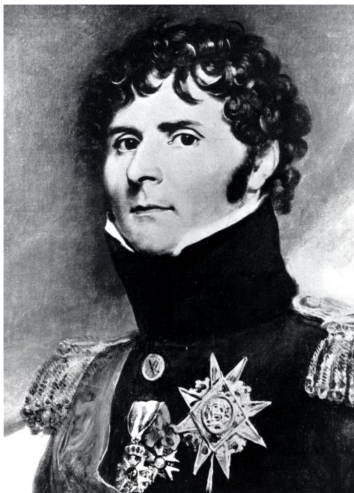
Karl XIV Johan, anfader till kungaätten i Sverige