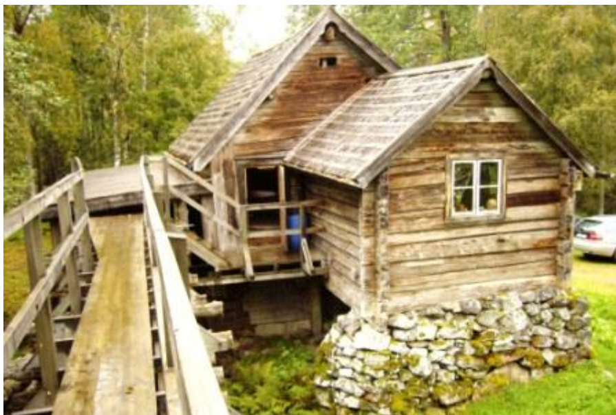
Den restaurerade Stenkars kvarn