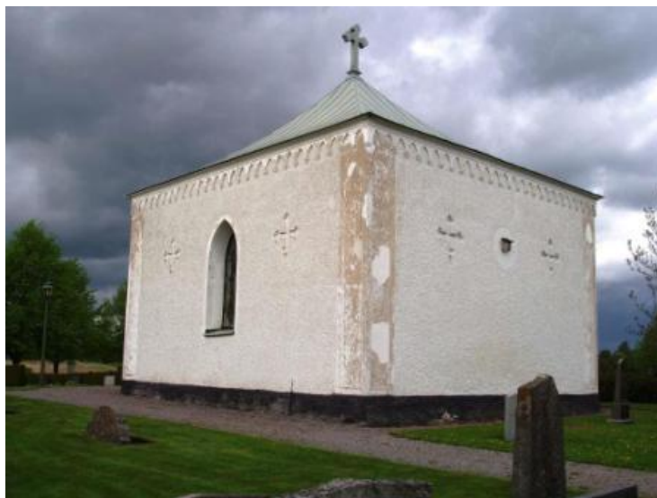
Skärkinds begravningskapell; del av Skärkinds gamla kyrka