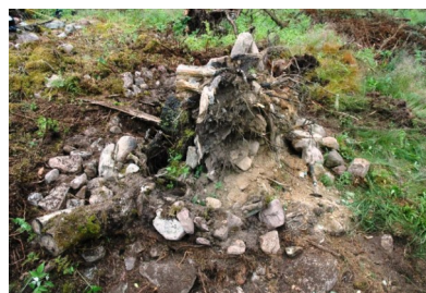
Rotvälta med brända ben. Röset är registrerat som Vallsjö 39