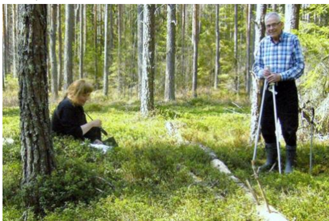
Granskning av kolningsgropar

"Vid provstick med jordsond i groparnas botten konstaterade vi att där fanns rikligt med kol"