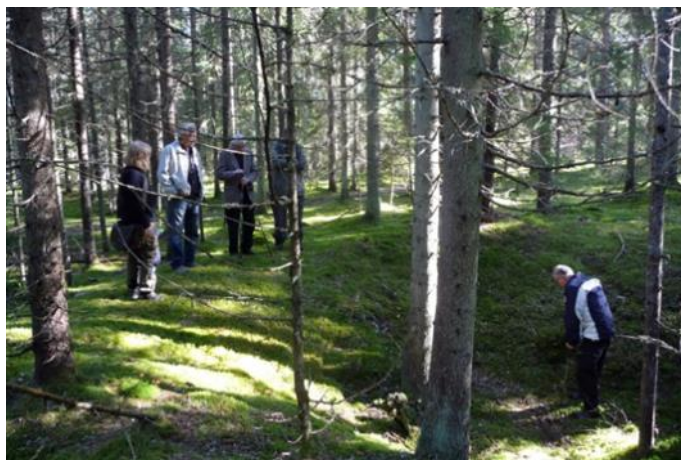
Kolningsgrop i Taberg