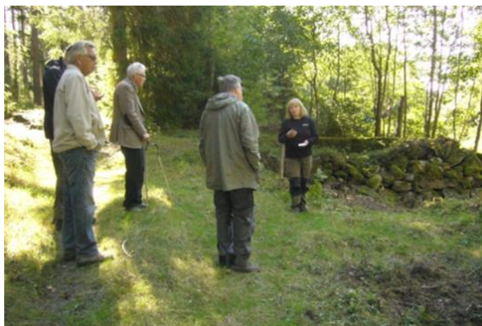
Rester av tidig masugn