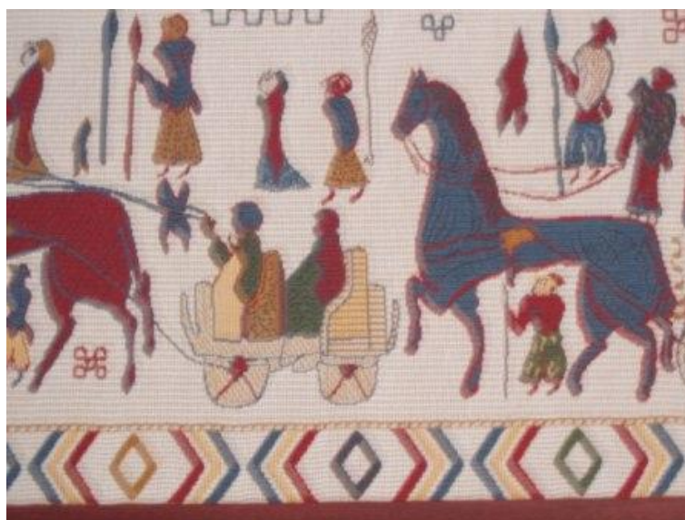
Detaljer från replik av bonad enligt ovan.