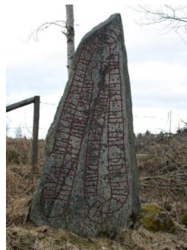
Runstenen i Nömme