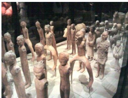
Foto 3: Han-dynastins kejsare var mer återhållsamma med terrakottafigurerna. Men det fanns även husdjur bland figurerna.

Foto 2: Terrakottasoldater från Qin-kejsarens skyddsvakt. Det tog nära 40 år och 700.000 man att färdigställa graven med soldater. Vid utgrävningen hittade man tre gånger med soldater etc. och en som var tom.