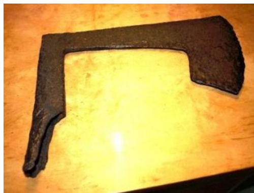
Foto. Yxan från Flisby