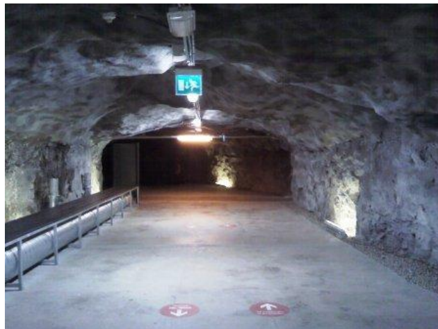
Foto 1: Tunneln där utställningen var. Det är, passande nog i detta sammanhang, en gammal militär konstruktion från tiden för andra världskriget.