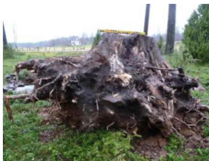
Figur. Jordfyllning och stenar, insprängda mellan rötterna, rensades bort. Rotvältan lyftes bort med fyrhjulig motorcykel och vinsch. Skadan reparerades och graven återställdes.