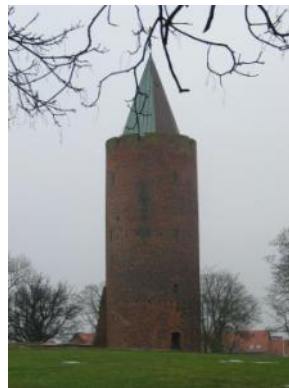
Gåsetårnet. Vordingborg, Danmark.

Valdemar Atterdag lät bygga ut och befästa borgen på 1300-talet så att den blev den näst största försvarsanläggningen i Danmark.