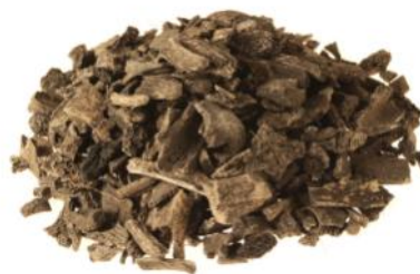
Figur. Bland de brända benen identifierades fragment av mänskliga, häst, hund, svin och eventuellt fågel. Studiet av benmaterialet har gett oss ny intressant information om en av gravarna i Norra Ljunga.