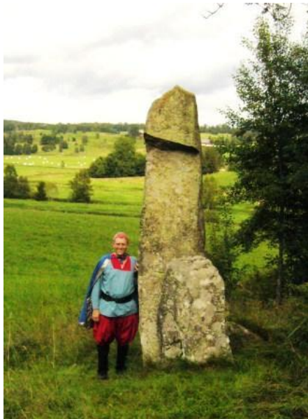
Skådespelare och Fallosstenen i Bredestad