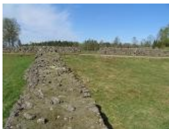
Foto på muren i Snarebo